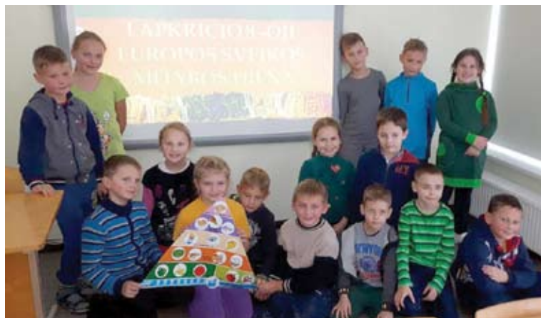
Europos sveikos mitybos diena Aukštadvario mokykloje-darželyje „Gandriukas“