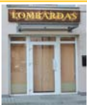
Užs. Nr. 892

Darbo dienomis 9–17 val. tauriųjų metalų supirkimas, lombardas, juvelyro paslaugos.