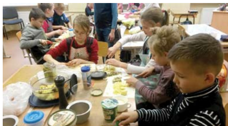
Europos sveikos mitybos diena Trakų pradinėje mokykloje