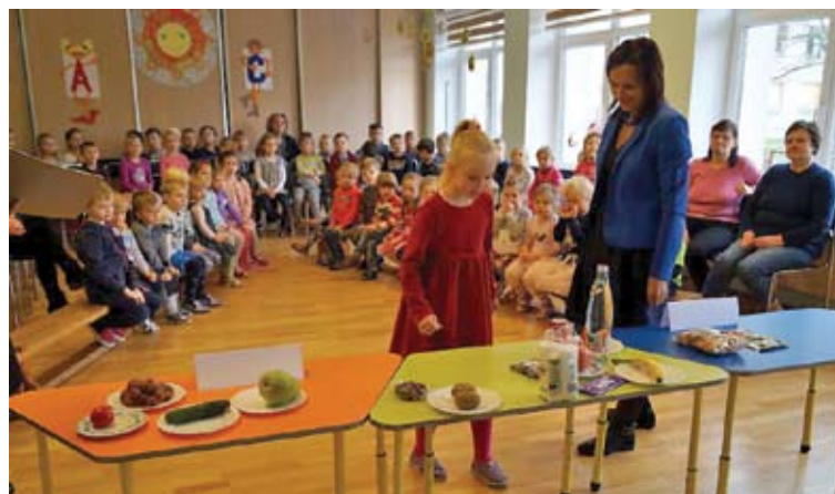
Europos sveikos mitybos diena Trakų lopšelyje-darželyje „Ežerėlis“