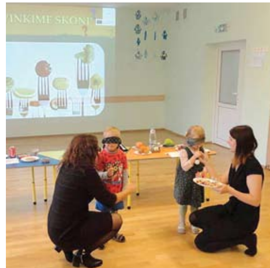
Europos sveikos mitybos diena Trakų lopšelyje-darželyje „Ežerėlis“