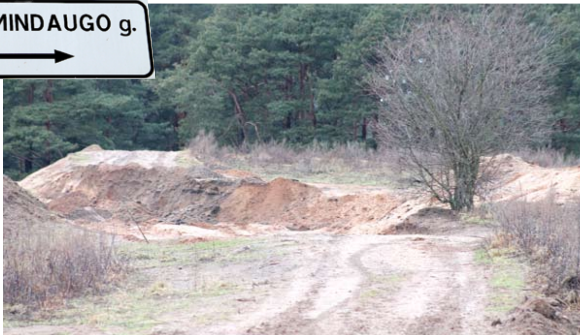
Perkasta Karaliaus Mindaugo gatvė Trakuose

Trakai – legendinė Lietuvos sostinė, turi beveik visų didžiųjų Lietuvos kunigaikščių gatves (išskyrus Algirdo, Žygimanto Kęstutaičio, Jaunučio, Vytenio, Karijoto, Aleksandro Jogailaičio, Vytauto Didžiojo dukters Sofijos Vytautaitės – Maskvos kunigaikštienės). Nors rajono gyventojai ne kartą kreipėsi į rajono savivaldybės tarybą siekiant įamžinti svarbių valstybės valdovų atminimą, tačiau gatvių pavadinimų klausimas juda lėtai. Vis dėlto viena gatvė, pavadinta pirmojo ir vienintelio Lietuvos karaliaus Mindaugo vardu, turi įdomią atsiradimo istoriją. Jau šimtmetį egzistuoja kelias nuo dabartinės S. Neries iki vadinamosios prekybinės bazės. 2012 m. rugpjūčio 30 d. Trakų rajono savivaldybės tarybos sprendimu Nr. S1-214