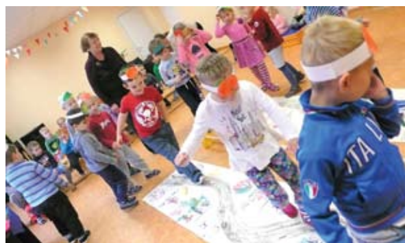
Europos sveikos mitybos diena Lentvario lopšelyje-darželyje „Svajonėlė“