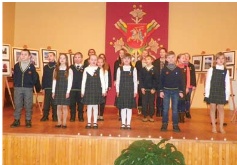
Sausio 13-oji buvo minima Onuškio D. Malinausko gimnazijoje.

Sausio 13-ąją – Laisvės gynėjų dieną Onuškio Kipro Petrausko aikštėje suplevėsavo trispalvė, languose įsižiebė žvakutės.