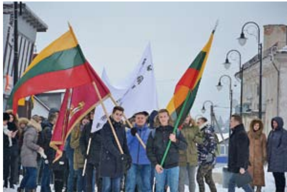
Moksleiviai, garbingai nešdami trispalvę, žygiavo į Lentvario bažnyčią, kur buvo aukotos šv. Mišios už žuvusiuosius