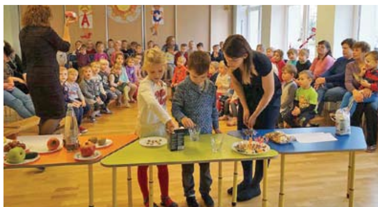
Europos sveikos mitybos diena Trakų lopšelyje-darželyje „Ežerėlis“