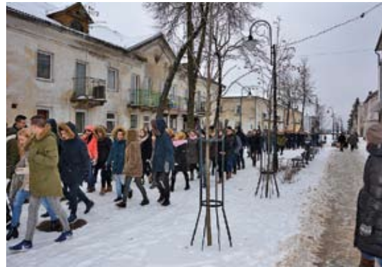
Sausio 13-osios minėjimo šventinė eiseną Lentvaryje

Prabėgo jau 26-eri metai nuo tos gilų pėdsaką Lietuvos istorijoje palikusios 1991 m. sausio 13-osios nakties, kai vienybės ir laisvės siekio vedini Lietu- vos piliečiai pasiekė istorinę pergalę. Tauta atsilaikė prieš sovietinių okupantų agresiją bei bandymą karine jėga įvykdyti perversmą ir apginę atkurtos valstybės nepriklausomybę.