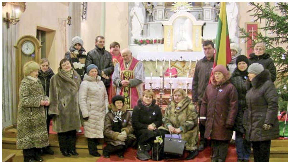
Už Sausio 13-osios žuvusiuosius buvo aukotos šv. Mišios