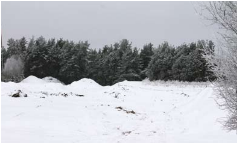
Gatvė yra, kelio nėra