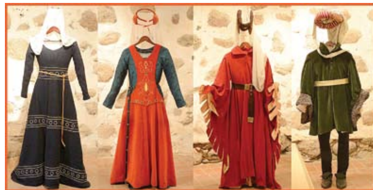
„Gotikinio kostiumo samprata: nuo askezės iki prabangos“ paroda