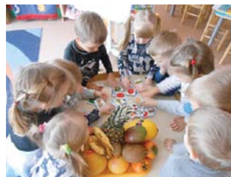
Europos sveikos mitybos diena Lentvario lopšelyje-darželyje „Šilas“