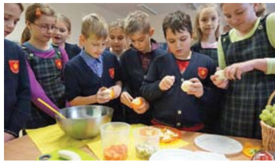
Europos sveikos mitybos diena Lentvario pradinėje mokykloje