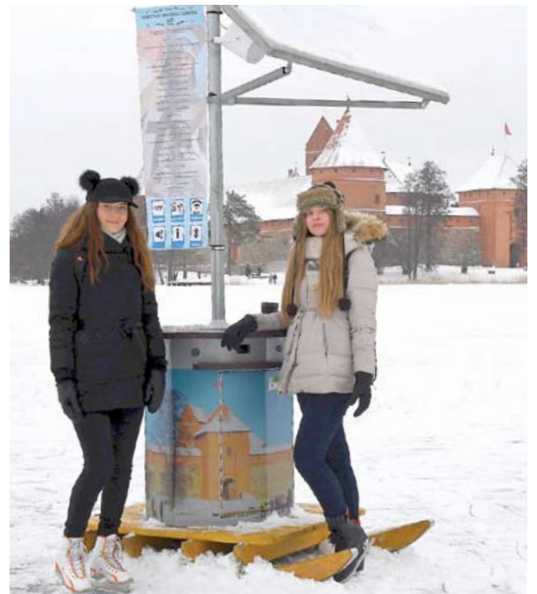
Trakų gyventojus ir svečius neįprastoje vietoje – čiuožykloje ant Galvės ežero ledo priešais Trakų Salos pilį – pasitinka saulės baterija maitinama viešos erdvės stotelė

Trakų gyventojus ir svečius neįprastoje vietoje – čiuožykloje ant Galvės ežero ledo priešais Trakų Salos pilį – pasitinka naujovė. Tai du ant ant rogučių pritvirtinti įrenginiai „Sun eco“, kurie maitinami saulės baterija.