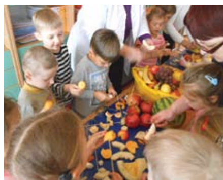
Europos sveikos mitybos diena Lentvario lopšelyje-darželyje „Šilas“